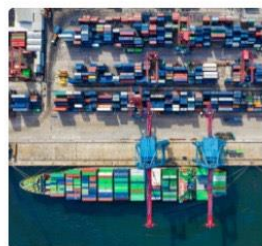
加船加班加艙資訊