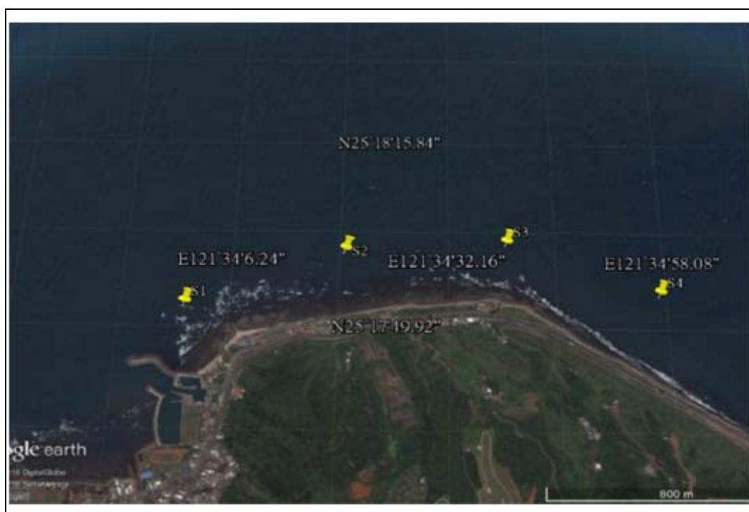
新北市海域監測位置示意圖