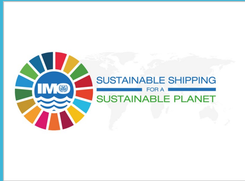
World Maritime Theme 2020: Sustainable Shipping for a Sustainable Planet