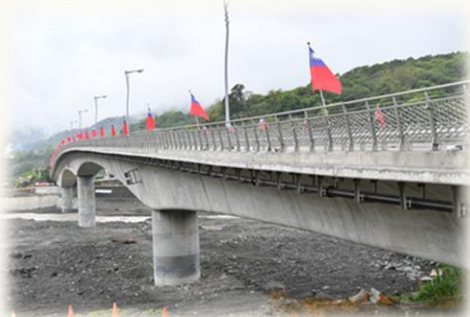
高雄六龜寶來一橋通車