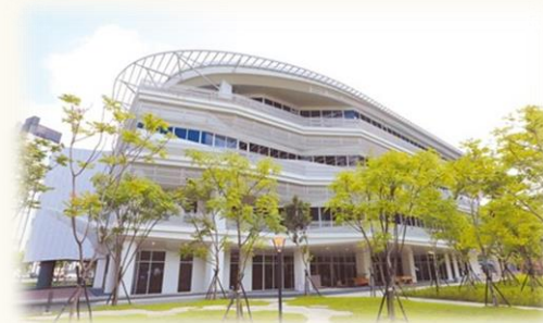
國家電影及視聽文化中心開館