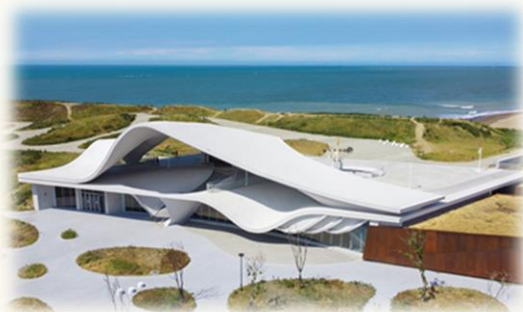
永安海螺文化體驗園區開園