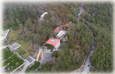
南橫公路全線有條件復通