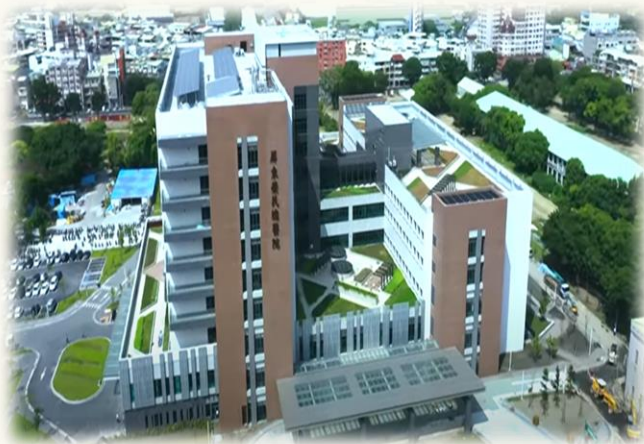
屏東榮民總醫院啟用