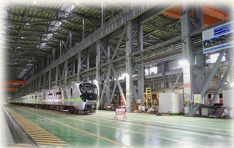
臺鐵潮州機廠啟用