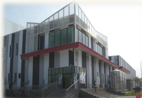
屏東國際保鮮物流中心啟用