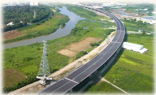
臺南都會區北外環道路(第3期)通車