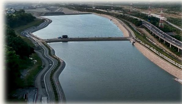
烏溪烏嘴潭人工湖AB湖區供水